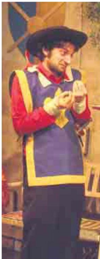
"La vera storia (o quasi)... di tre moschettieri" al Teatro Vascello