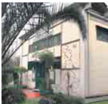
La facciata del Teatro Mongiovinio

Teatro Vascello Via Giacinto Carini, 78 Tel. 06.588102