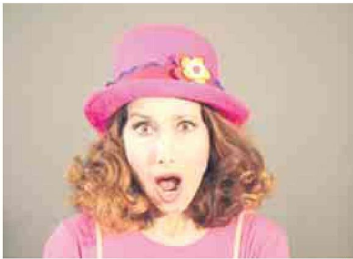
"Mrs. Spelling e... i Funambles", al Teatro Sistina

“ Dal Mongiovinio al Sistina, a Le Maschere e il Vascello