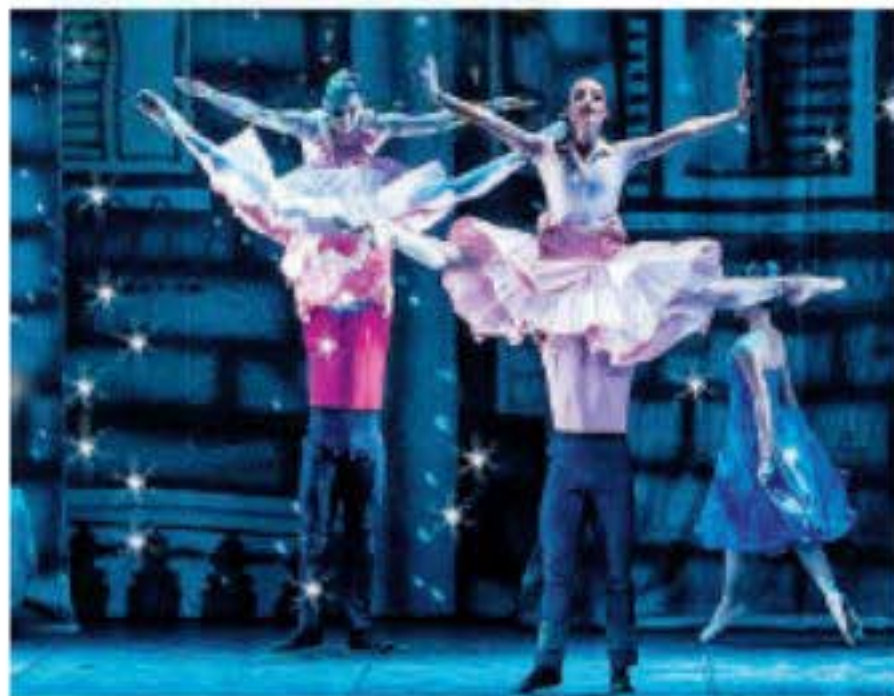
In alto una scena da "Terramia"; accanto la Compagnia Il Balletto del Sud ne "La bella addormentata"